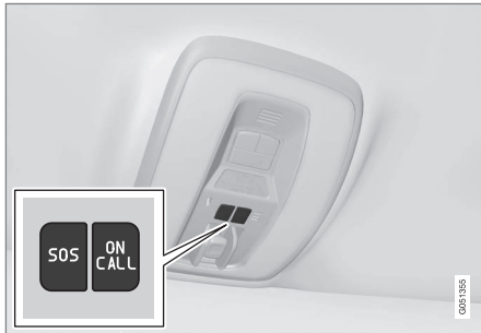
Les boutons Volvo On Call

VOC est connecté aux systèmes d'airbag et d'alarme du véhicule. Le véhicule possède un module Global System for Mobile Communications (GSM) intégré qui gère la communication entre le véhicule et le centre d'assistance à la clientèle VOC.