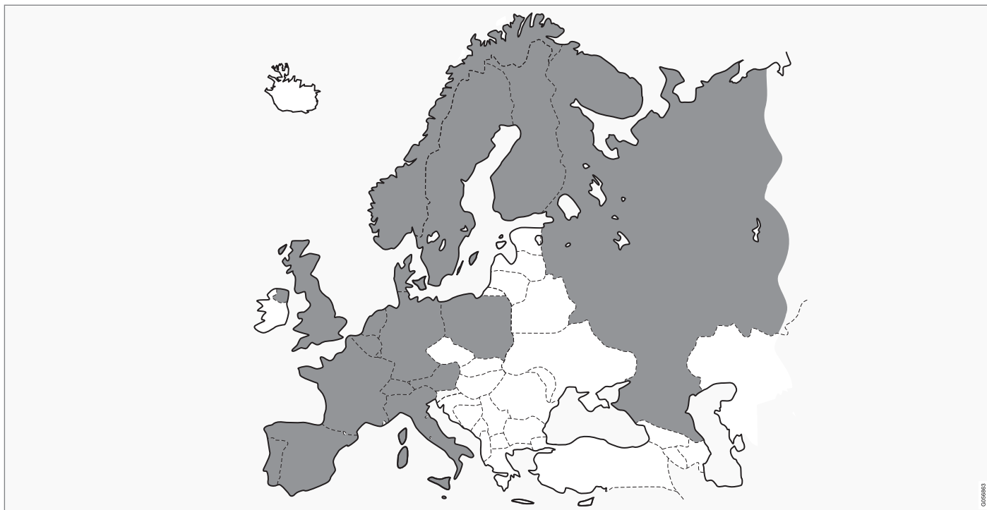
Volvo On Call on käytettävissä harmaalla merkityillä alueilla.